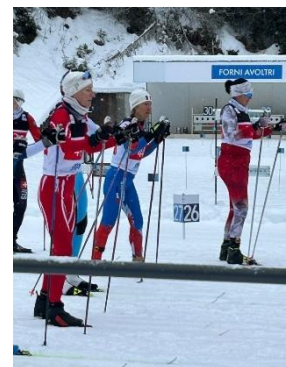
Avant le Top départ...