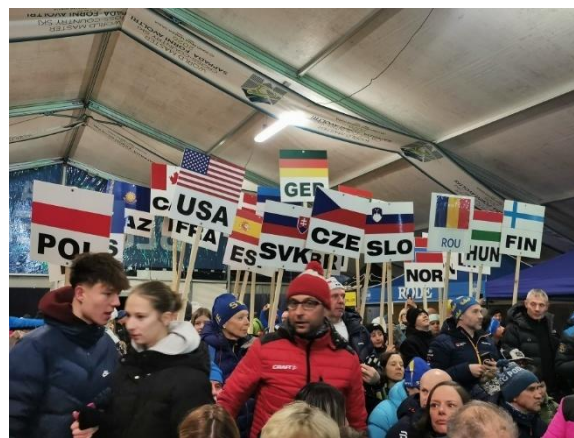
De nombreuses nations représentées