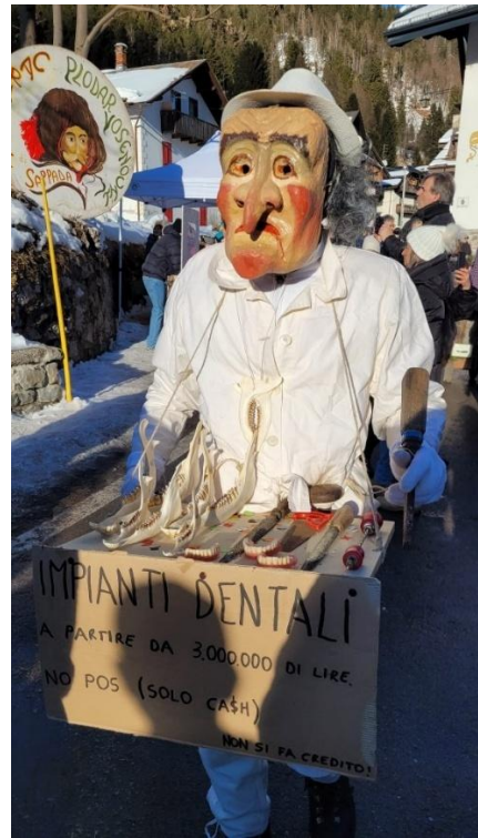
Déambulation dans les rues avec des déguisements très originaux.