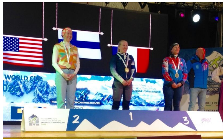
Podium F1 (Race 3)