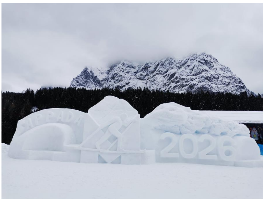
Sculpture de glace sur le stade des compétitions