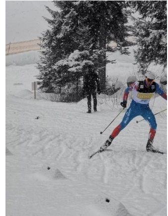
Et pour nos Masters masculin, de la neige, de la neige et encore de la neige...