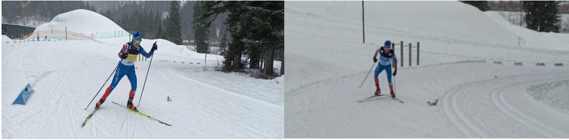
Relais féminin en course...