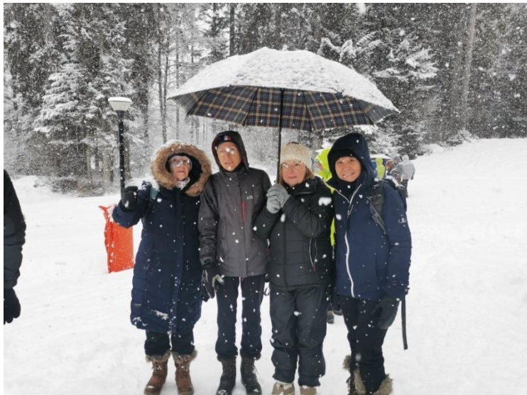
Mais le « fan club » est là pour encourager nos valeureux Masters ...