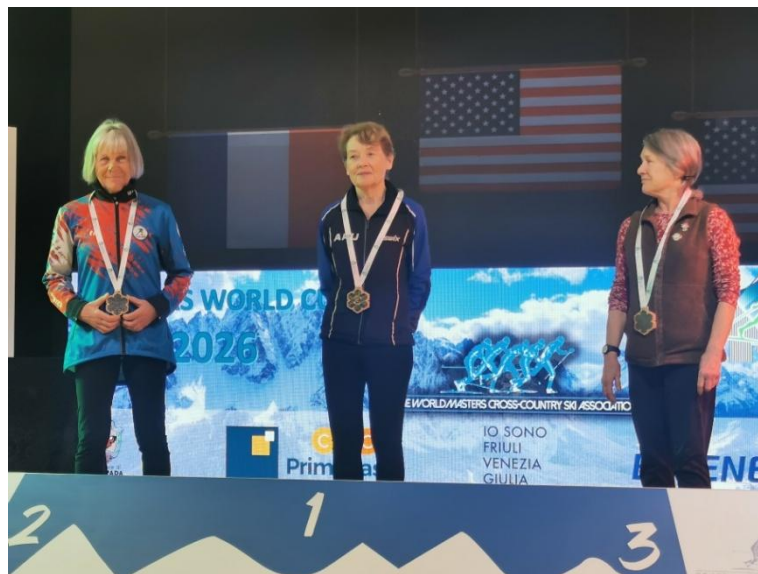
Podium F10 (Race 5)