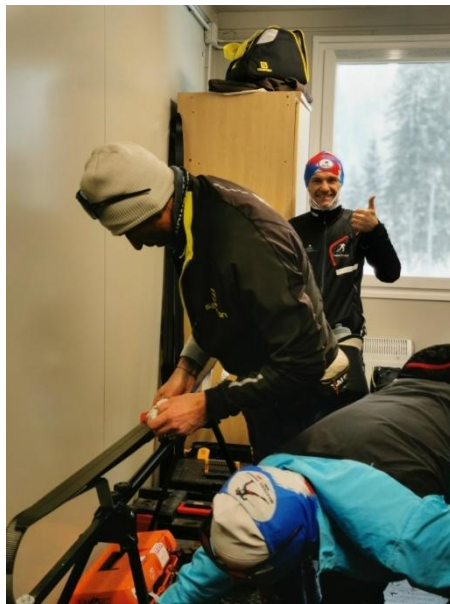
A l'heure du fartage... choisir le bon !

Pas de médaille pour la France sur ces relais, mais malgré tout une bonne ambiance et de l'entraide en amont, en particulier pour le fartage en classique.