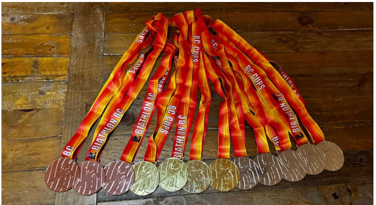
La moisson de médailles pour la France, chacun(e) au moins une !