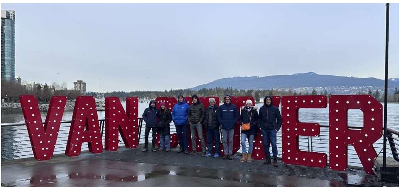
Visite au port de Vancouver