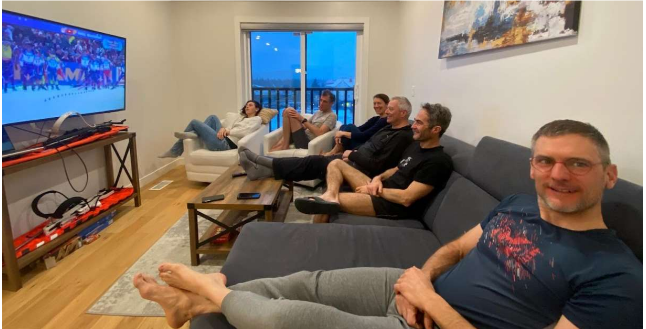
Entre deux entrainements, biathlon à la TV !