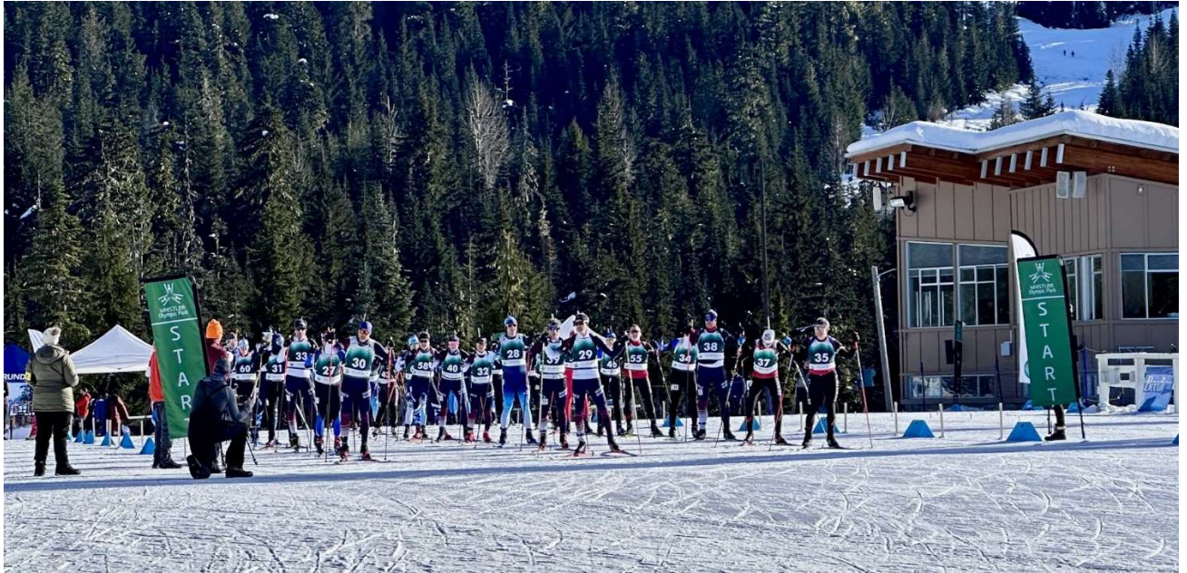
Départ de la Mass Start à Whistler