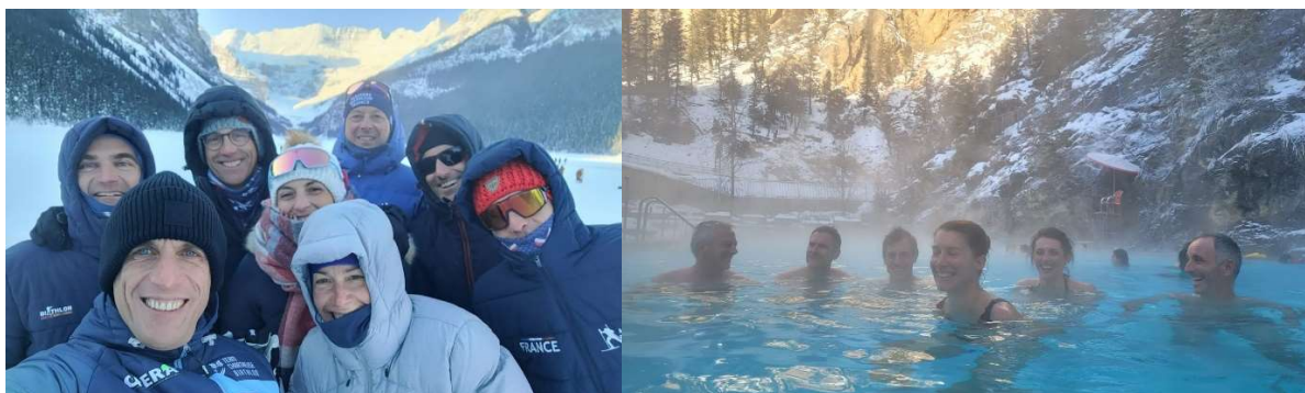
Les huit à Lake Louise et Radium Hot Springs

En début de deuxième semaine, après une rapide visite de Calgary et d'un Steakhouse local, le groupe s'est envolé pour Vancouver, Colombie Britannique, toujours plus à l'ouest, pour une visite de ville, et un ski en nocturne à Cypress Mountain, sur de magnifiques pistes éclairées et avec vue sur les lumières de Vancouver.