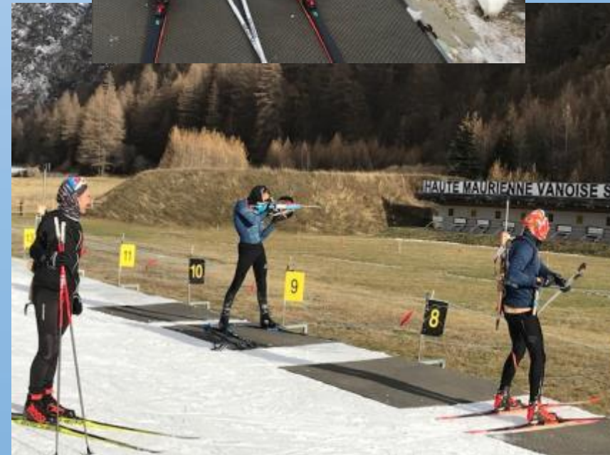
ers Nordique France Champagny en Vanoise le 15 mars 2024