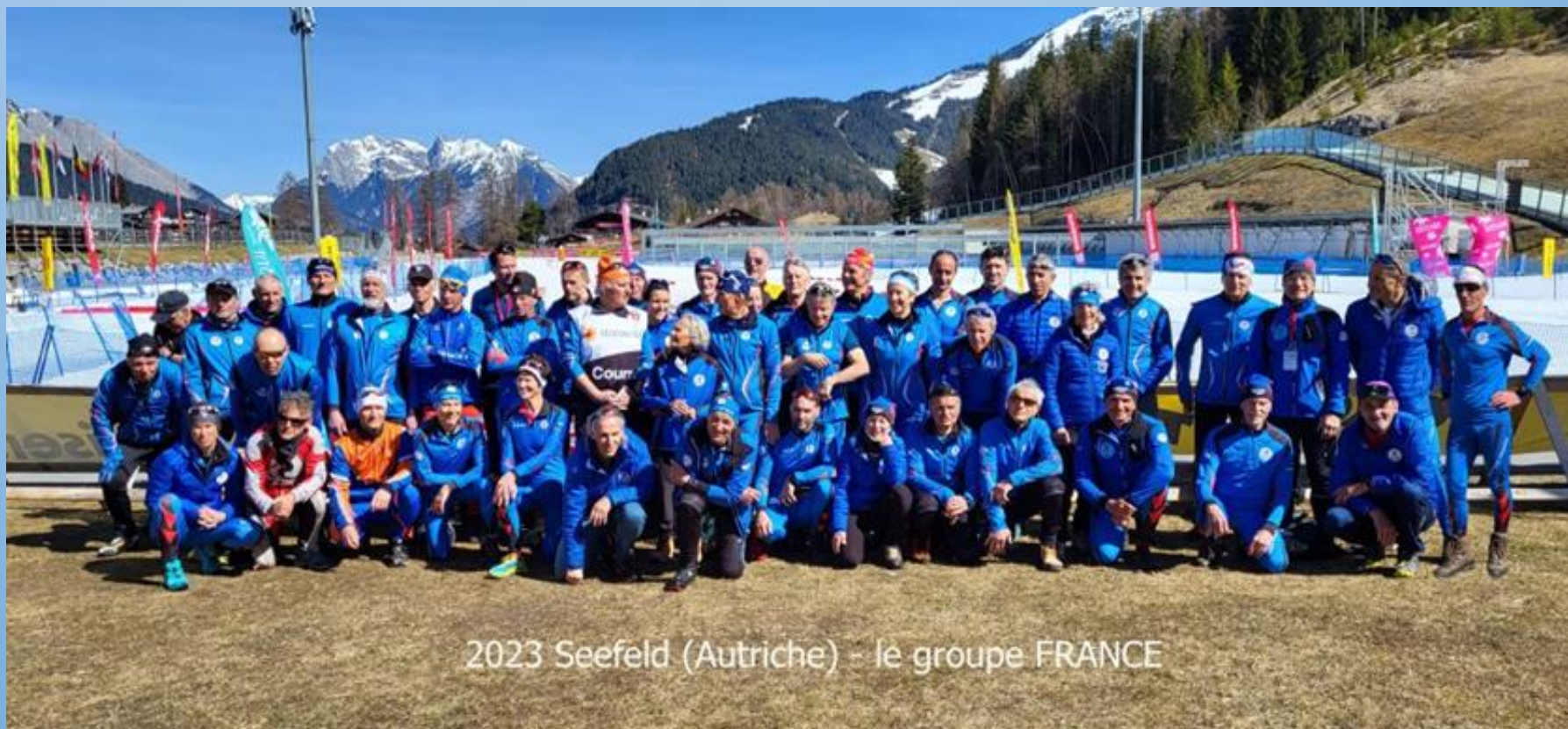
2023 Seefeld (Autriche) - le groupe FRANCE